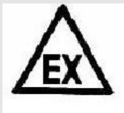
Locale con possibile presenza di atmosfera esplosiva

Segnalare con cartelli conformi a quanto stabilito dall'articolo 293 (comma tre) del D.Lgs. 81/2008 la presenza di zone con pericolo di esplosione (cartello a forma triangolare; lettere in nero su fondo giallo, bordo nero; lettere da riportare: "EX"):